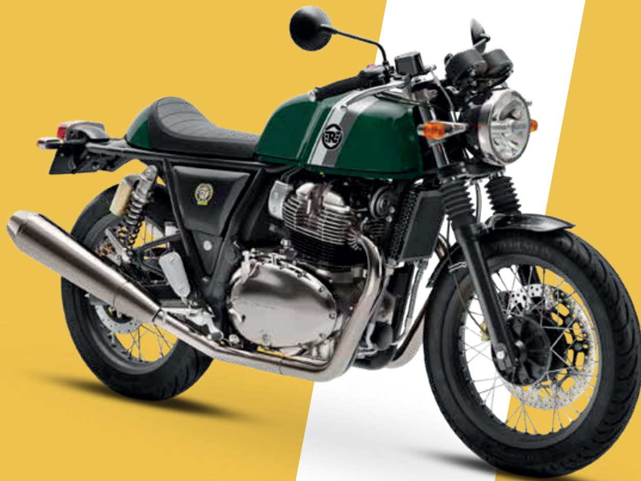
BRITISH RACING GREEN